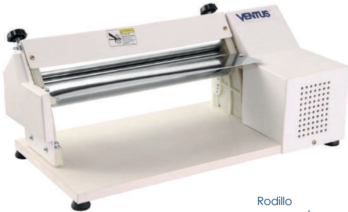
Rodillo acero cromado