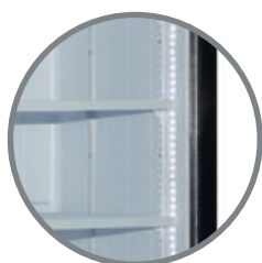
Repisas regulables Iluminación interior LED