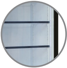
Repisas regulables Iluminación interior LED a ambos lados