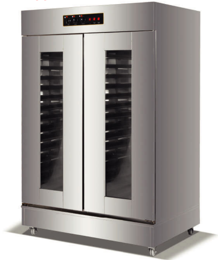
Puerta vidrio templado