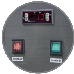
Controladores y termostato digital