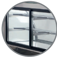
Puertas correderas posteriores