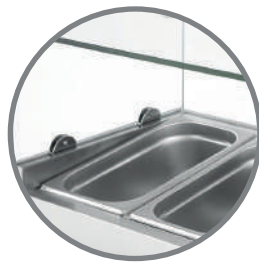
Área depósitos GN