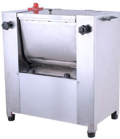
Aspas en acero inoxidable

Equipo ideal para comercio y cadenas Food Service