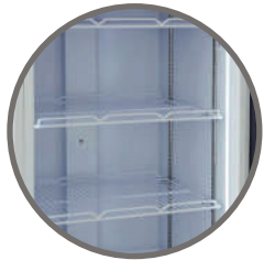
Repisas regulables Iluminación interior LED