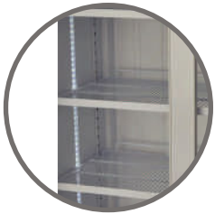
Repisas regulables Iluminación interior LED a ambos lados