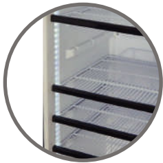
Repisas regulables Iluminación interior LED a ambos lados