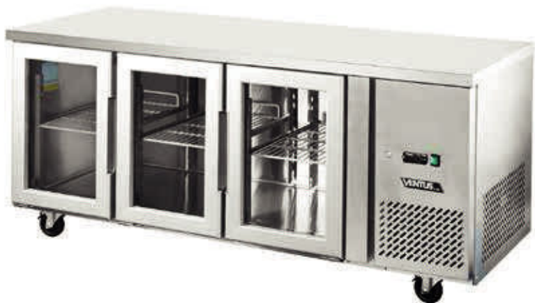
Controlador Digital Carel

Equipo ideal para preparación y refrigeración de productos