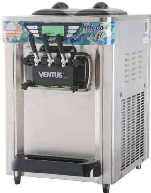
Panel touch Manillas sabores

Equipo especializado en producción de helado soft